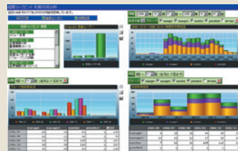
▲アクセス状況モニタリング画面 (Dr.Sum EA Visualizer を使用)

Dr.Sum EAの集計結果を多彩なグラフを用いて、グラフィカルなイメージで可視化