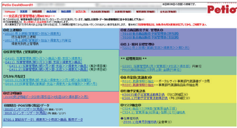
社内ポータルから誰でも分析結果を参照できる

業務上必要としている定型レポートやデータ検索画面を、ノンプログラミングで手軽に作成・登録可能。見たいレポートメニューをクリックするだけで、誰もが簡単にデータを取得できるため情報を素早くビジネスに生かせる。